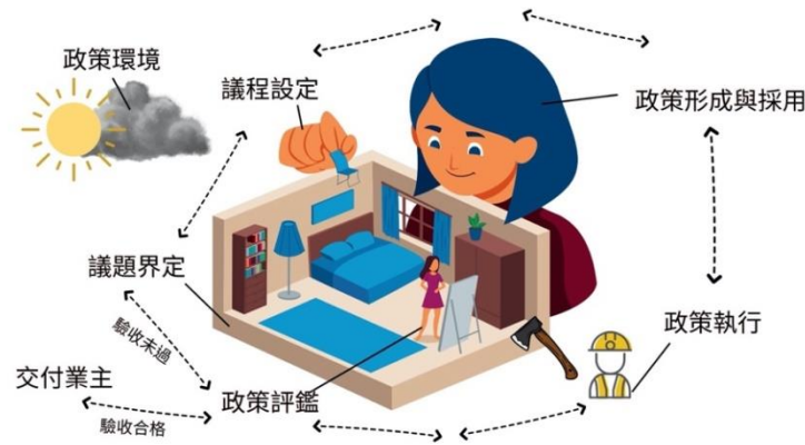
圖1 室內裝修隱喻模式圖